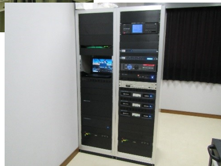
・アンプ等の機器架