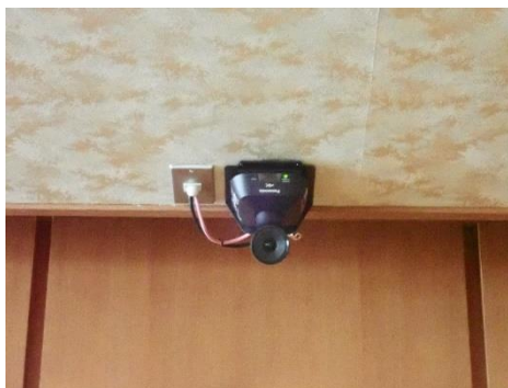
・4Kインテグレートッドカメラ